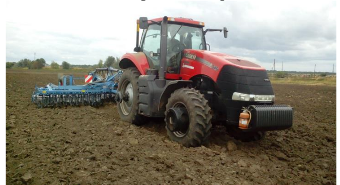
Трактор Case з культиватором