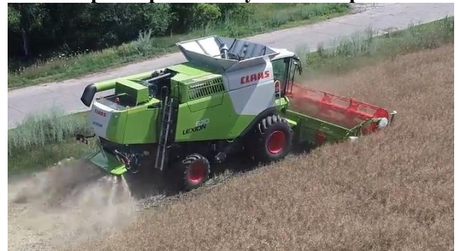
Обмолот озимого ріпаку