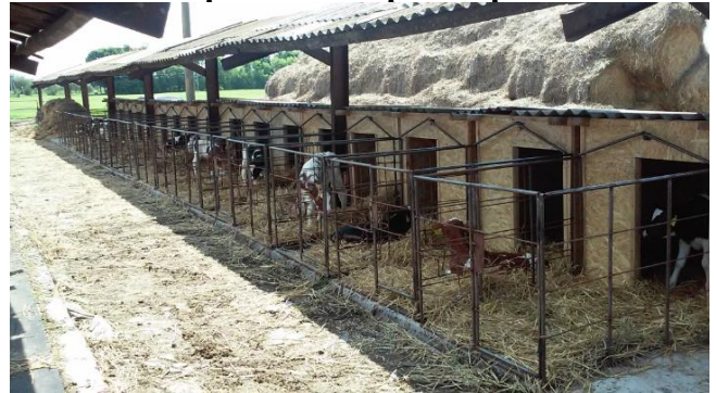
Будиночки для телят